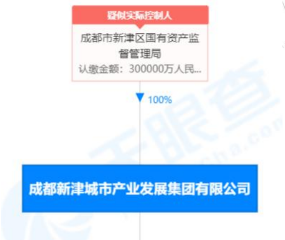
成都新津城市产业发展集团有限公司股权结构图：